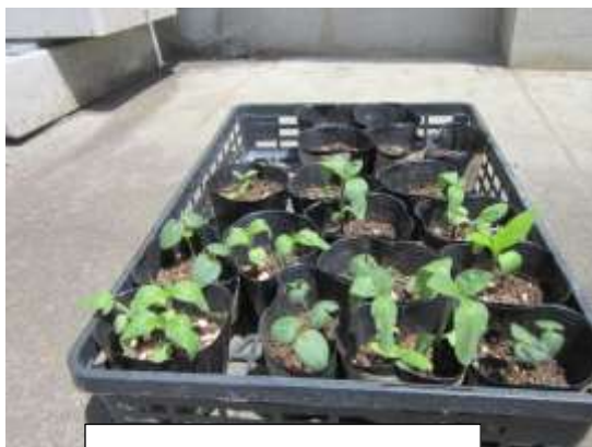
3年生の野菜いろいろ